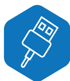
ALIMENTAÇÃO USB tipo C