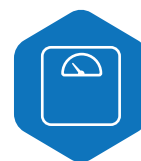
PESO 14 gramas